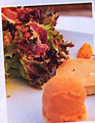
Arriba, menú completo de El Llagut y, sobre estas líneas, bouquet de ensaladas con helado de pimiento escalibado del restaurante Arcs.

Suculentas ofertas hasta el 28 de febrero