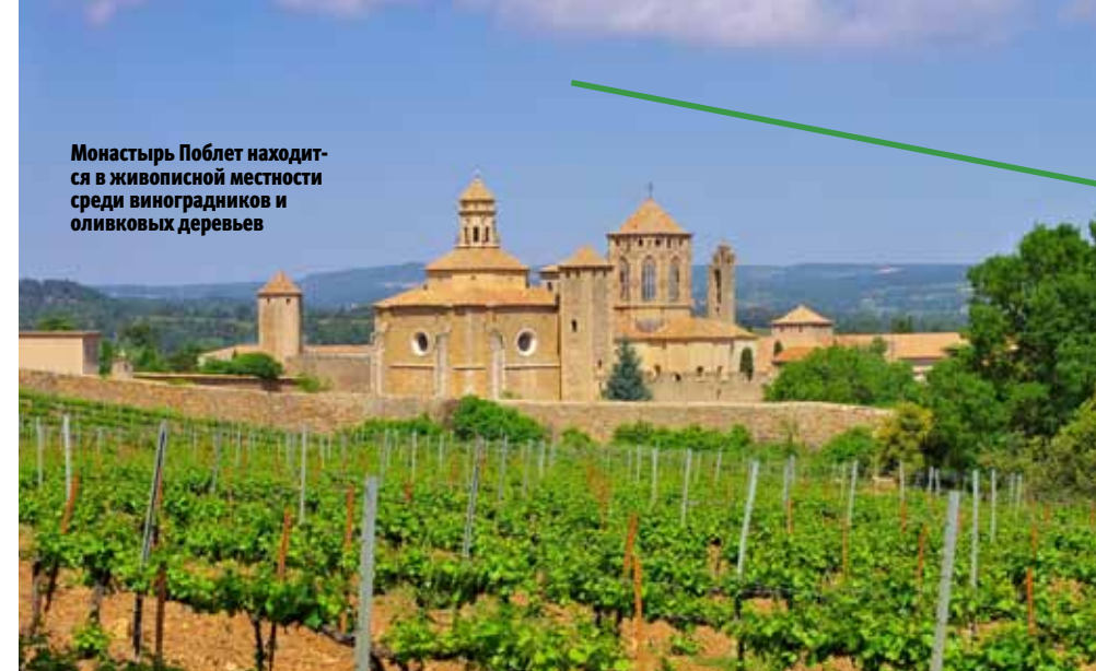
Монастырь Поблет находится в живописной местности среди виноградников и оливковых деревьев