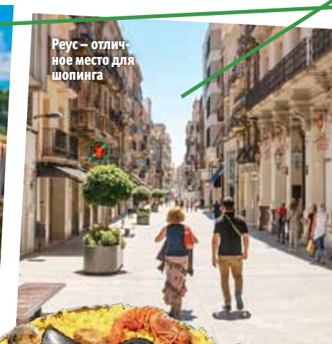
Реус – отличное место для шопинга

настырь Поблет, основанный в XII веке, величественно возвышается у подножия горы Прадес. Здесь тебе предстоит увидеть королевские гробницы, аскетичные кельи монахов и грандиозные трапезные. Кстати, Поблет до сих пор остается обителью 30 монахов-цистарианцев, ведущих затворнический образ жизни. Хочешь побывать в месте, где зародилось виноделие в регионе Приорат? Тогда тебе в полуразрушенный, но необычайно атмосферный картезианский монастырь Скала-Дей. А чтобы погрузиться в классическое испанское средневековье, отправляйся в очаровательный городок Монблан. Прогуляйся по готическим улочкам, пройди по крепостной стене, взберись на одну из башен и полюбуешься неповторимой панорамой.