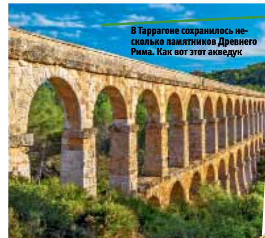
В Таррагоне сохранилось несколько памятников Древнего Рима. Как вот этот акведук