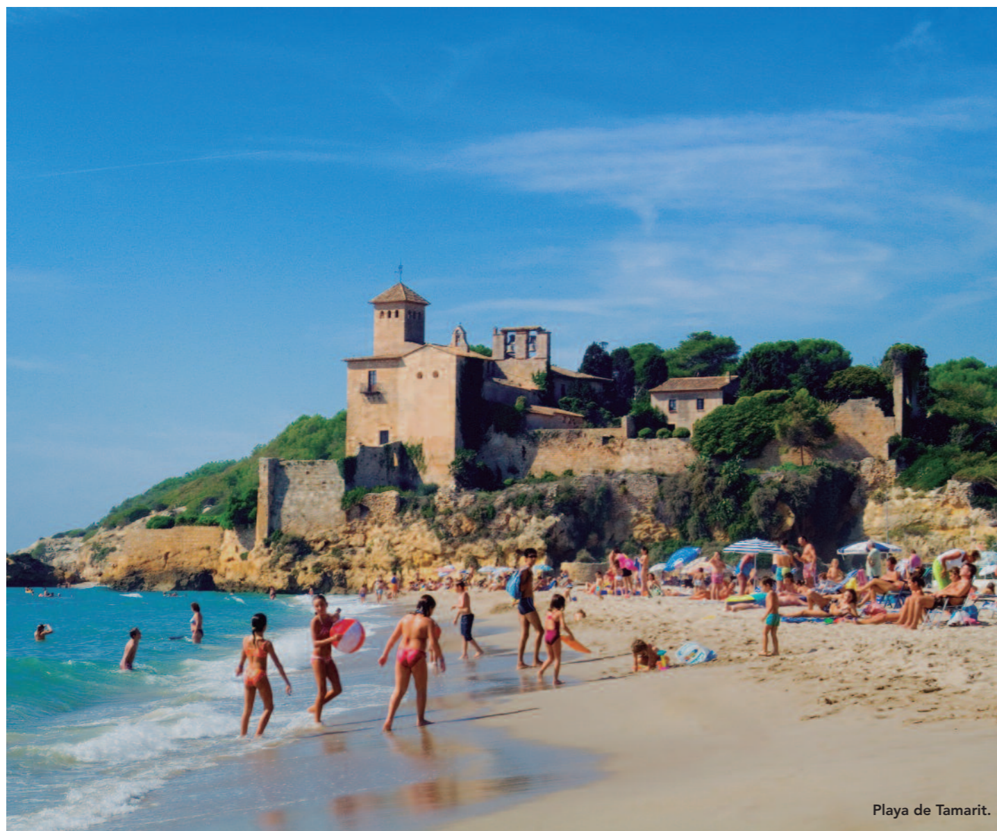
Playa de Tamarit.

Diez playas y calas para disfrutar del Mediterráneo