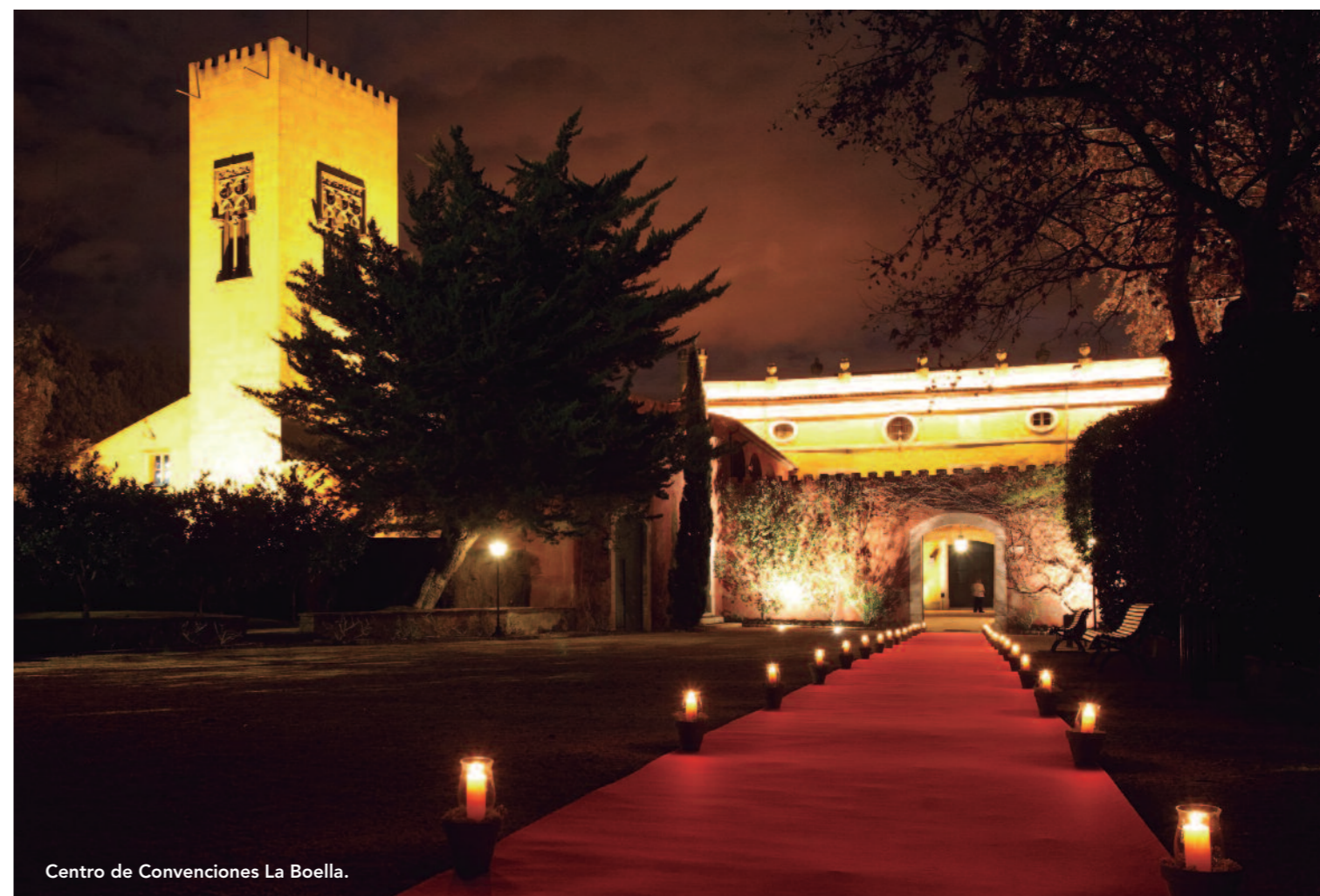
Centro de Convenciones La Boella.