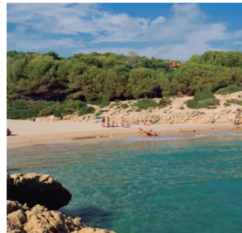
Playa dels Capellans.

La propia Tarragona ofrece al visitante allí alojado dos notables arenales urbanos: el Miracle –frente al Anfiteatro y la modernista barandilla del balcón del Mediterráneo– que va desde el puerto hasta la Punta Grossa, y l'Arrabassada, con bandera azul; ambas con medio kilómetro de fina arena y muy anchas, para que los bañistas se ubiquen sin agobios. Siguiendo rumbo norte, dos playas más pequeñas: la Savinosa, de 350 metros y bandera azul; y Els Capellans, de 60 metros. Ambas son la antesala del gran arenal tarraconense, la playa Larga; tres kilómetros de casi infinita arena para perderse paseando entre las suaves olas que la acarician.