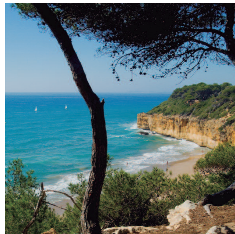
Playa de L'Arboç.

AUNQUE EL POTENTE IMÁN CULTURAL DE SU PATRIMONIO ROMANO MONOPOLICE GRAN PARTE DE SU ATRACTIVO TURÍSTICO, TARRAGONA TAMBIÉN ES UN DESTINO DE LA COSTA DORADA DE PRIMER NIVEL, AVALADO POR SU AGRADABLE CLIMA Y LA BELLEZA DE SUS PLAYAS DE FINA ARENA. 15 KILÓMETROS BAÑADOS POR EL MEDITERRÁNEO, CON SIETE PLAYAS Y TRES CALAS, PERMITEN DISFRUTAR DE CHAPUZONES COMBINADOS CON VISITAS MONUMENTALES.