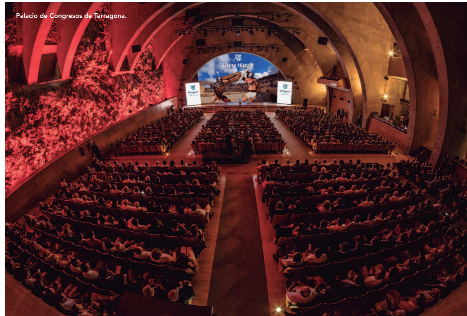
Palacio de Congresos de Tarragona.

Muy especial resulta el Centro Tarraconense ‘El Seminari’, situado justo detrás de la Catedral. Este espacio acoge parte de la historia de Tarragona: una zona de la muralla romana y, sobre todo, la capilla de Sant Pau, del siglo XIII, cobijada en uno de sus magníficos claustros neoclásicos. Un espacio único donde realizar reuniones desde 15 personas hasta grandes actos con unas 300.