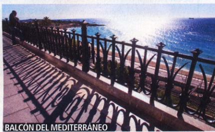
BALCÓN DEL MEDITERRÁNEO