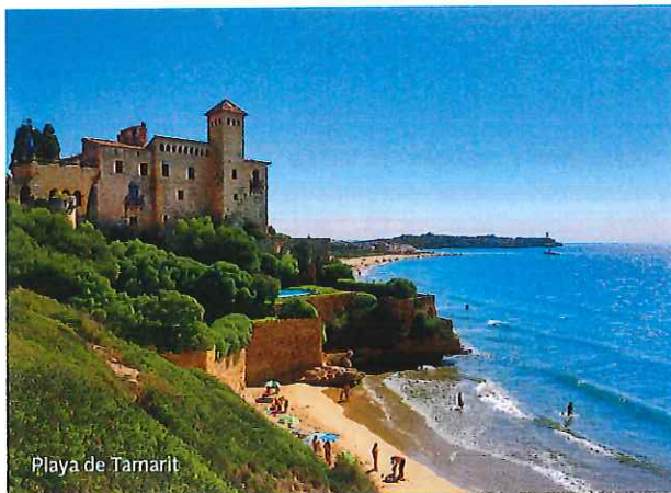
Playa de Tamarit

cas y populistas». El circo de Tarraco, construido el siglo I y con aforo para 25.000 personas, estaba destinado a carreras de caballos y cuádrigas. Hoy es uno de los mejor conservados al oeste de Roma.