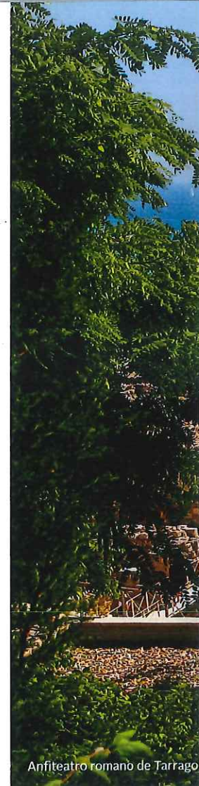
Anfiteatro romano de Tarragona

Por su ubicación a orillas del Mediterráneo el anfiteatro de Tarraco fue uno de los más admirados del Imperio. Desde el siglo II y con capacidad para 15.000 personas, albergaba los espectáculos más populares de la época: las ejecuciones públicas y la lucha entre animales y gladiadores. Según Eudald Carbonell «no es casualidad que se construyese junto al mar, para que el desembarco de los animales fuera más sencillo».