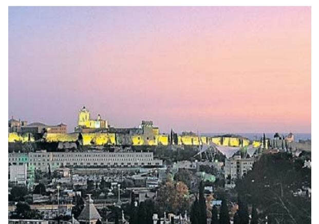
RAFAEL LÓPEZ-MONNÉ / TARRAGONA TURISME

Canviem ara totalment de perspectiva i ens desplaçem fins al barri portuari del Serrallo. Allà, en plenes instal·lacions del Port de Tarragona, hi ha el passeig de l'Escullera, un camí d'uns quatre quilòmetres de llargada que s'endinsa al mar i on trobem punts tan emblemàtics com el far de la Banyà. Des d'allà, no només tenim una vista privilegiada del port i de l'horitzó, sinó també una de les vistes més boniques de la ciutat, ja que podreu observar des del Serrallo fins a la Part Alta envoltats per les onades.