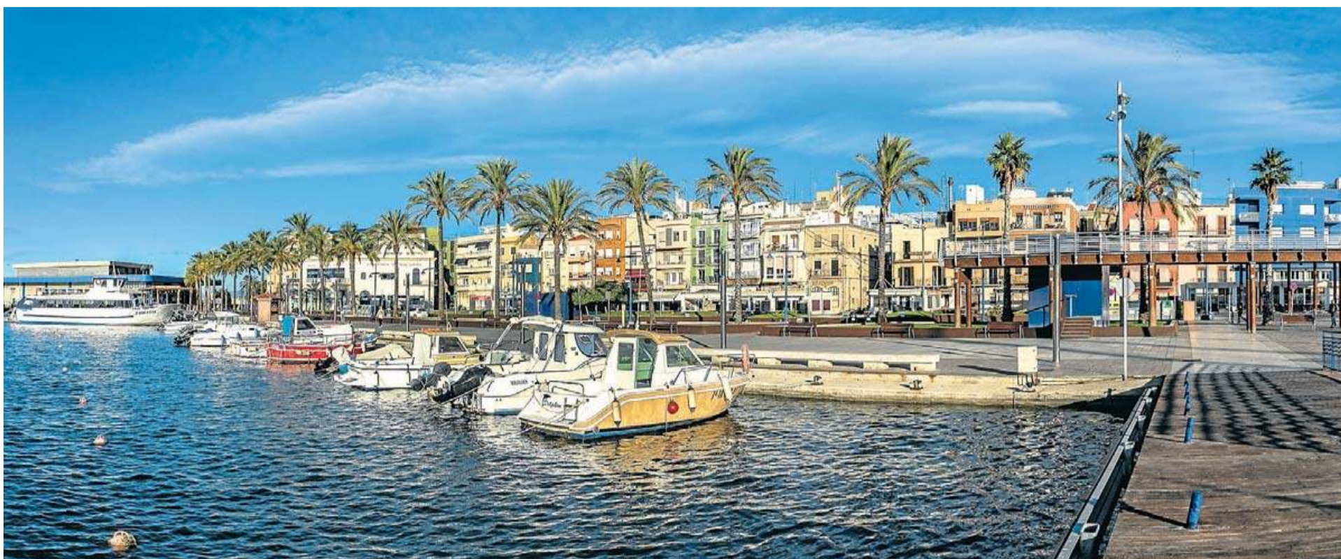
Una panoràmica del barri mariner del Serrallo, dotat d'una gran personalitat i que ha estat reconegut per l'Agència Catalana de Turisme.