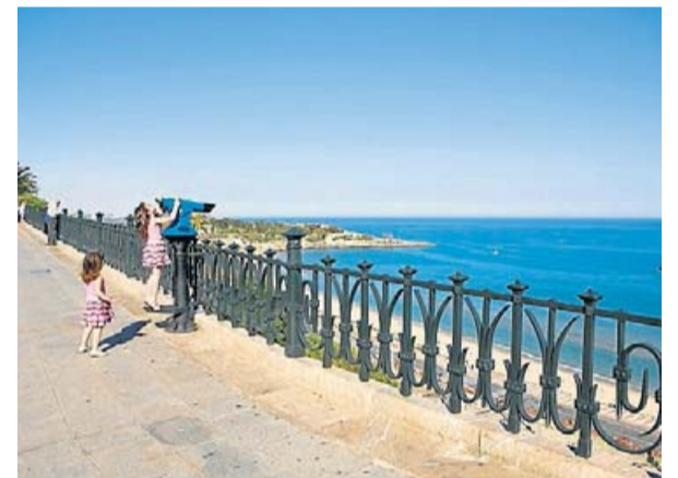
JOAN CAPDEVILA VALLVÉ / TARRAGONA TURISME

Continuem a la part més elevada de la ciutat. En aquesta zona hi trobem diversos punts amb vistes privilegiades. Un d'ells, que destaca per la facilitat d'accés, és el mirador de Sant Antoni. El sant dona nom al passeig on està situat, als jardins que té al costat -on trobem la creu de Sant Antoni, que amb uns 9 metres d'alçària i pedra del país és l'obra escultòrica exempta més antiga de Tarragona- i al portal que dona al passeig de Sant Antoni, que és una de les portes d'accés a la muralla de la ciutat. Des d'aquí observem part de la zona llevant de la ciutat i la punta i la platja del Miracle.