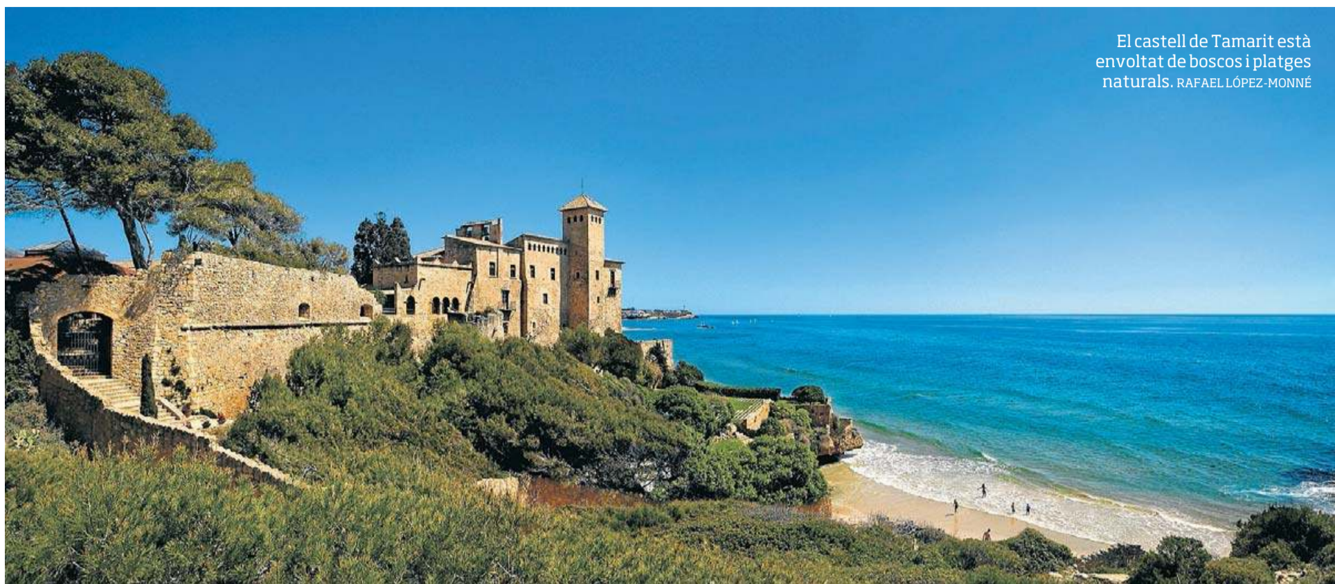
El castell de Tamarit està envoltat de boscos i platges naturals. RAFAEL LÓPEZ-MONNÉ