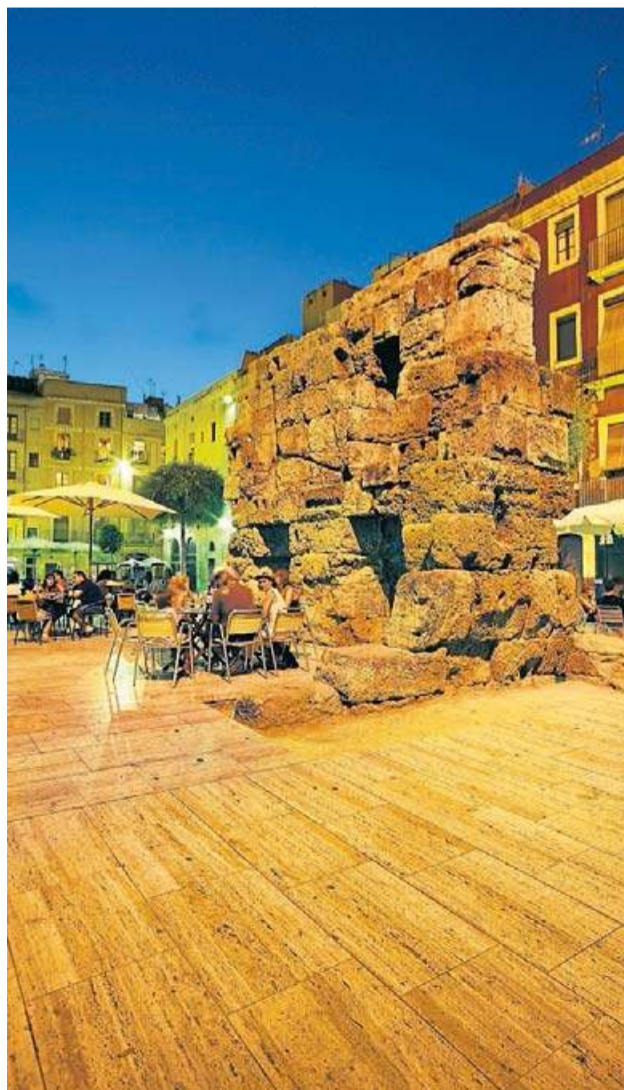
A la plaça del Fòrum podem prendre alguna cosa o dinar rodejats de restes romanes. RAFAEL LÓPEZ-MONNÉ

Però la Tarragona medieval també és molt present al casc antic de la ciutat, la Part Alta, amb la Catedral com a espai principal, però a més podeu endinsar-vos en els carrers estrets d'aquesta zona de la ciutat i recórrer l'antic call jueu. Tarragona és una ciutat moderna, amb la Rambla Nova com a gran artèria principal, ideal per passejar i també per fer unes compres. És