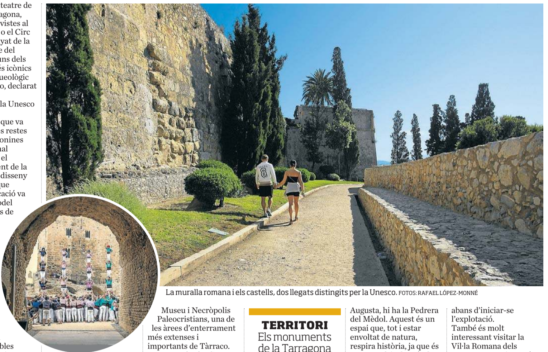
La muralla romana i els castells, dos llegats distingits per la Unesco.

Un dels monuments més destacats és, sense cap mena de dubte, el Pont del Diable, també conegut com l'aqüeducte de les Ferreres. La conducció recollia l'aigua