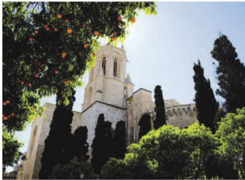
La Catedral de Tarragona és un exemple de transició de l'estil romànic al gòtic.

El final de l'ocupació àrab va provocar el renaixement de l'art medieval a Tarragona. L'expansió del cristianisme va consolidar aquest estil i es van crear noves muralles de protecció i edificis de caire religiós que encara podem veure. En són un exemple el Mur Vell, del segle XII, i les seves torres de Morenes i d'Arandes, que es van construir sobre el mur romà. A la mateixa zona hi ha el castell de Paborde, actualment el Palau Arquebisbal, del qual només es conserva una façana, i la Torre de l'Arquebisbe, culminada per elements